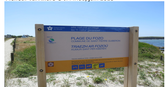
Site du Conservatoire du littoral Saint-Pierre Quiberon © Y. Rech, juin 2018