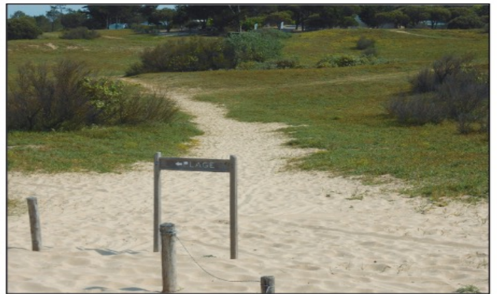
Monofil sectionné et sente sur la Dune des Gouillauds, Le Bois-Plage-en-Ré © J. Piriou, mai 2018