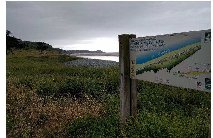
Site de la Ville Berneuf Pléneuf Val André © J. Piriou, juin 2018