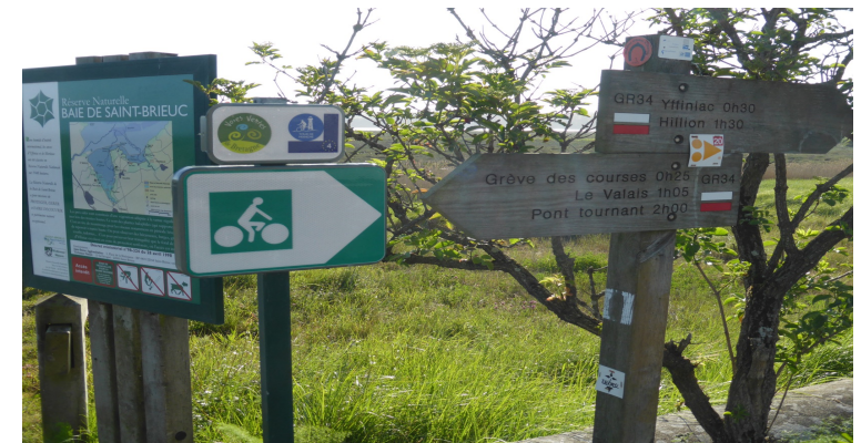
Site de Boutdeville à Languieux, © J. Piriou, mai 2017

Le début d'une transition territoriale et touristique?