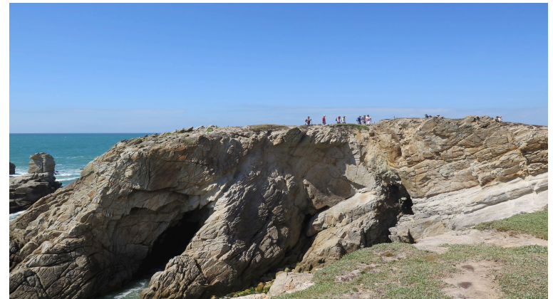
Côte Sauvage, Saint-Pierre Quiberon © Y. Rech, juin 2018