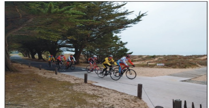
Croisement piste cyclable et itinéraire piéton Secteur Plage Nord, Rivdeux-Plage © J. Piriou avril 2017