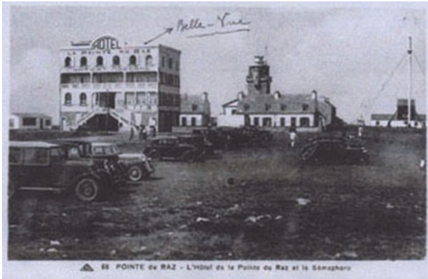
Stationnement des véhicules au pied du sémaphore de la Pointe du Raz en 1930