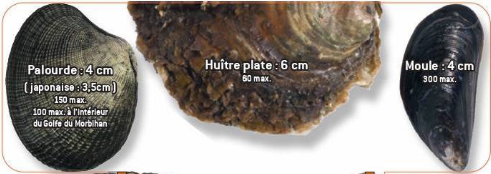
Palourde : 4 cm ( japonaise : 3,5cm) 150 max. 100 max. à l'intérieur du Golfe du Morbihan