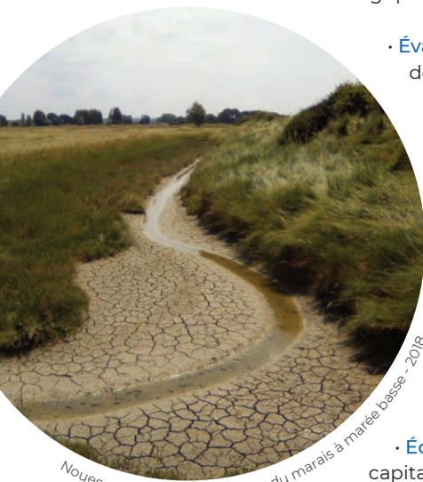
Nouvelles paysages à l'intérieur du marais à marée basse - 2018