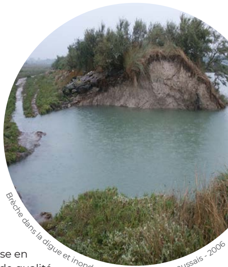
Bèche dans la digue et inondation du marais de Beaussais - 2006