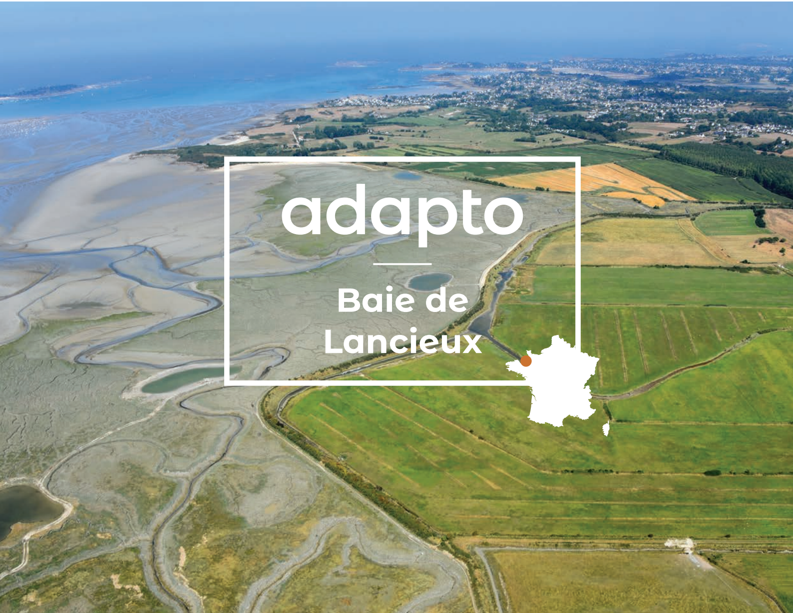
Baie de Lancieux à marée basse - 2016

Au Moyen-Âge, les moines bénédictins de l'Abbaye de Saint-Jacut ont édifié une digue, aujourd'hui appelée « digue aux Moines » pour gagner des terres cultivables sur les marais maritimes. Deux autres digues ont été construites par la suite. A l'abri derrière ces ouvrages, l'Homme a construit des routes et quelques habitations tout en créant des paysages naturels et agricoles d'une grande diversité.