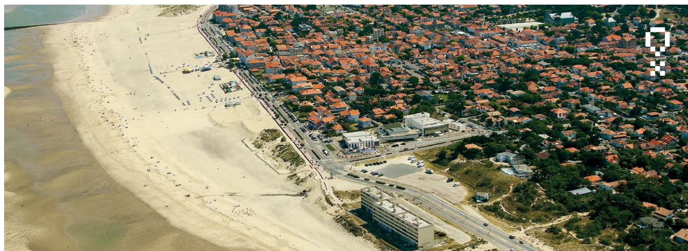
Front de mer de Soulac-sur-Mer