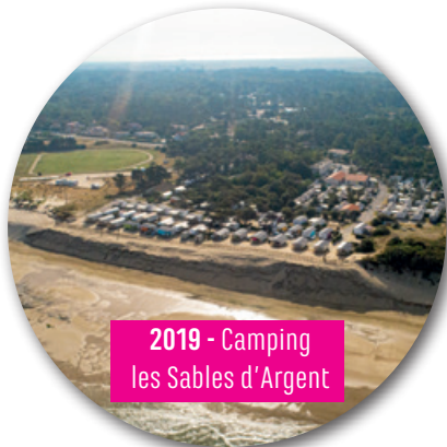
2019 - Camping les Sables d'Argent