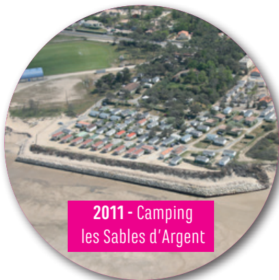
2011 - Camping les Sables d'Argent