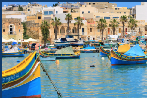
Font de mer de Marsaxlokk

À Malte, l'équipe de PERICLES a travaillé avec les parties prenantes de la municipalité de Marsaxlokk pour coproduire des visites touristiques audioguidées. Après plusieurs mois de travail, plus de 70 éléments du patrimoine culturel côtier et maritime (PCCM) ont été choisis et illustrés avec des photos et des récits sur la plateforme de narration izi.TRAVEL . En concertation avec les parties prenantes, une sélection d'éléments du PCCM a été réalisée afin de concevoir et développer 5 visites audioguidées numériques. Ces visites audioguidées mettent en avant une perspective originale du caractère halieutique, de l'histoire et des paysages maritimes de Marsaxlokk.