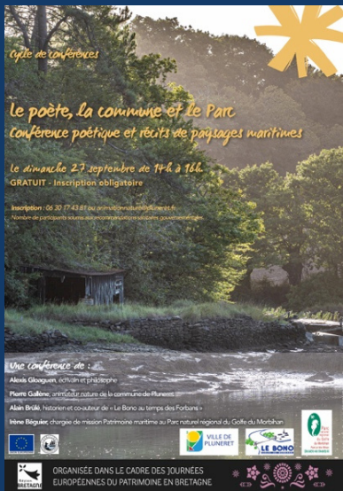
Affiche de la conférence

« Au Bono, la nature et l'histoire s'entrelacent »