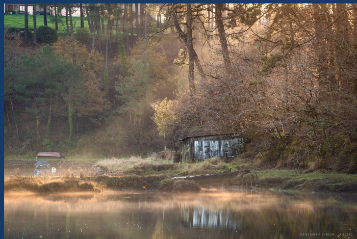
Photographies de la rivière du Bono

Cette approche sensible et poétique a permis d'aborder différemment le patrimoine, et s'est révélée être un outil de sensibilisation pertinent. Nicolas Le Gros explique, « En plus de l'émotion, la démarche invite à la discussion sur le patrimoine ».