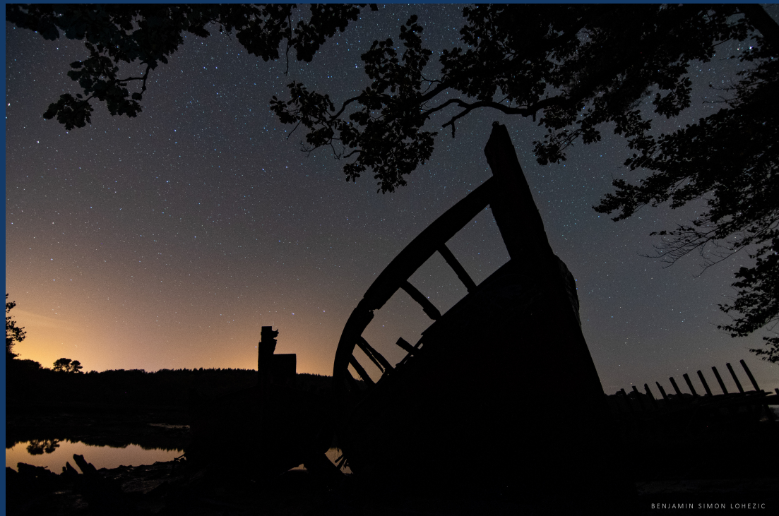
Cimetière de bateaux sur la rivière du Bono

AMURE (UMR 6308) - Université de Bretagne Occidentale (UBO) Parc Naturel Régional du Golfe du Morbihan (PNRGM) contact et abonnement : laure.zakrewski@univ-brest.fr