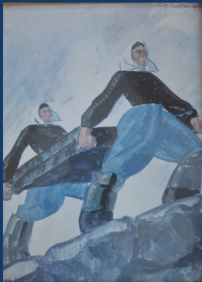
(c) Peinture de René-Yves Creston - Collection personnelle de Pierre-Yves Le Rouzic