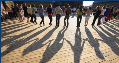
(c) Festi-Noz en Bretagne - Association « Bretagne Culture Diversité » (BCD)

Selon la définition de l' UNESCO , le patrimoine culturel immatériel (PCI) :