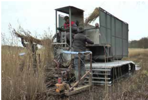
Coupe du roseau au Champ des Martyrs, Brec'h

Le tri et le conditionnement du roseau: les gerbes sont ensuite triées et peignées afin de les débarrasser des herbes de pied et des débris de tiges cassées, avant d'être calibrées en bottes égales. Après quoi, ces dernières sont conditionnées en ballots pour faciliter leur gestion. Elles peuvent alors être utilisées en couverture.