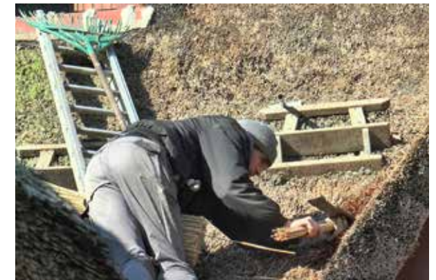
Remaniage: réinjection de roseau neuf dans les zones fragilisées

Remaniage: les animaux (oiseaux, fouines) peuvent dégrader la couverture en prélevant des brins ou en grattant le chaume, notamment dans les parties sensibles telles que le faîtage, les rives ou les souches des cheminées. Les creux ainsi créés empêchent l'écoulement des eaux et favorisent une usure plus rapide du chaume. Si nécessaire, le chaumier opère alors un remaniage. Il s'agit de réinjecter du chaume neuf dans les zones fragilisées. Ces dernières se repèrent à la plus grande souplesse du chaume et à sa moins forte densité, qui indiquent un relâchement de la pression sous les barres de fixation. Le chaume ainsi réinjecté est mis en forme à la main puis tapé à l'aide de la palette.