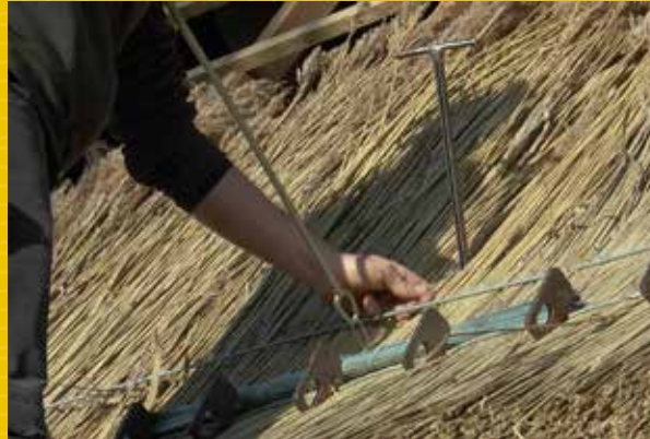
Passage des fils de ligature sous le liteau grâce à un jeu d'aiguilles afin de fixer la barre de fixation sur le chaume.

La technique de pose principalement utilisée par les couvreurs en chaume sur le territoire est la technique « à la barre ». Venue de Hollande dans la seconde moitié du XX e siècle, cette méthode consiste à prendre en étai le chaume entre le liteau de charpente et une barre de fixation en acier galvanisé afin de le maintenir en place.