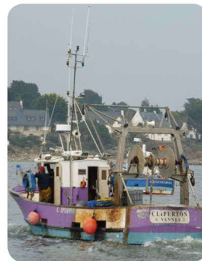
Petit chalutier de Port-Navalo (Arzon), armé pour la pêche à la morgate au filet et blancs prêts à la vente

Ils vendent la morgate entière. Les chalutiers ont des tailles très variables, d'une dizaine à plusieurs dizaines de mètres. Les pêcheurs sont généralement au moins deux à bord et ont une licence chalut les autorisant à pêcher avec cet engin.