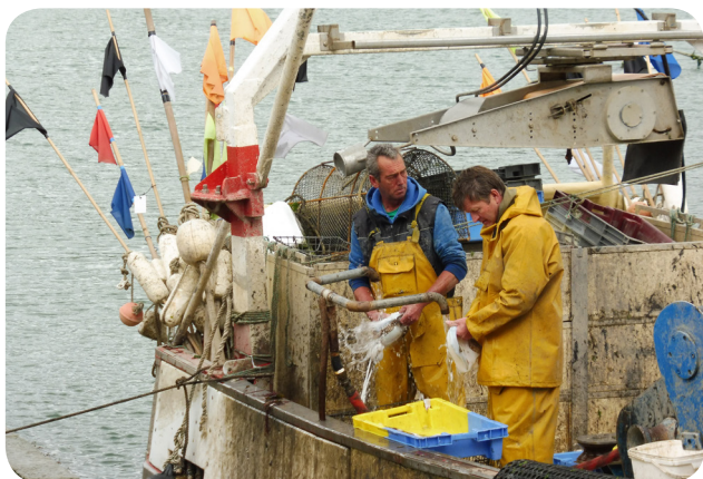
Mise en blanc des seiches au retour de la pêche, à Port-Anna, Séné

La pêche à la morgate émerge dans le Golfe dans les années 1930, au chalut à perche. Le chalut ne cible alors pas directement la seiche. Cette pêche se développe petit à petit dans les autres localités du Morbihan, notamment dans la rivière de Pénerf ou les baies de Quiberon et de Vilaine. Très vite, les techniques se perfectionnent. Pour cibler spécifiquement la seiche, les casiers à morgate apparaissent dès 1940.