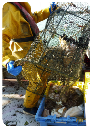
Relève des casiers à seiche Large de l'Île aux Moines

Les filières sont remontées casier par casier, vidées sur le pont du bateau, dans des bacs de criée. Sur le chemin du retour et arrivés à quai, le pêcheur et son matelot lèvent les blancs, enlevant les organes, l'os, et parfois la tête. Les ovaires des seiches femelles, proches de la noix de Saint-Jacques, en texture comme en goût, sont prisés des connaisseurs! Les casiers sont mis à l'eau fin mars et sortis à la fin de la saison de morgate, au mois de mai. Ils sont posés de préférence au-dessus des fonds sablo-vaseux, et notamment à proximité des fragiles herbiers de zostères, zones de nourrisserie, de reproduction et de ponte de nombreuses espèces de poissons, crustacés, coquillages et mollusques du Golfe.