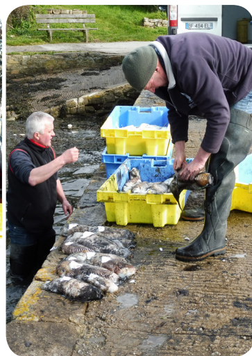
Mise en blanc des morgates Pen er Men (Arradon)